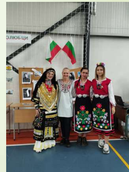
На снимките: Участници в национална ученическа конференция „Рибният буквар“ – Котел, 2024 г.; Ученическо състезание „Игри на родолюбците“; Ученици подготвят учебно-познавателни материали.